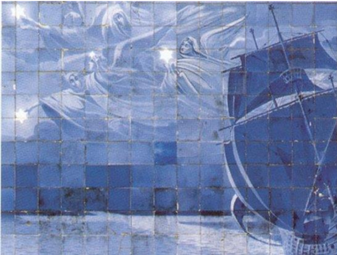
Cruzeiro do Sul , painel de azulejos de Jorge Colaço, 1922. (Pavilhão Carlos Lopes, Lisboa).

Abaixo a imagem do Cruzeiro do Sul, ilustrada com o Canto V, 14 de Camões, onde o poeta aponta o esquecimento que dela tinha-se até o início da expansão ultramarina.