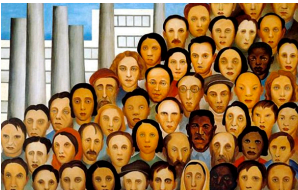
Tarsila do Amaral, *1.9.1886 in Sao Paulo, †17.1.1973 in Sao Paulo, „Arbeiter“

Brasilien hat heute geschätzte 186 Mio. Einwohner. Die Alterspyramide hat nahezu die klassische Tannenbaumform, d.h. eine breite Basis von jüngeren Menschen und eine sich ausdünnende Altersspitze.