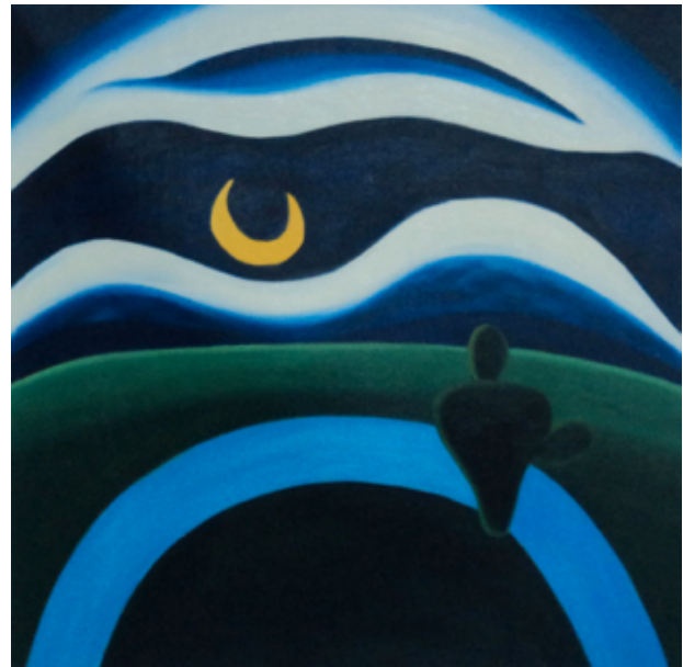
Tarsila do Amaral, „Der Mond“

Bäumen Tag wird. Die Ärmste kann nicht mehr gehen ...«