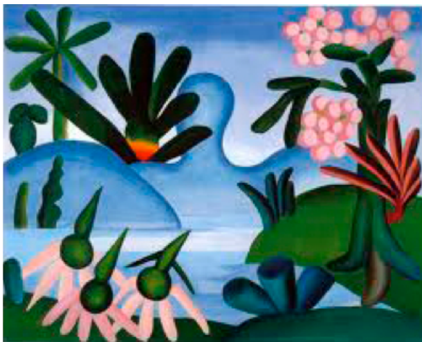
Tarsila do Amaral, „Am See“

Das erste Land, von dem die Bundesrepublik Deutschland nach dem 2. Weltkrieg zu einem Kulturaustausch eingeladen wird, ist Brasilien. Die Biennale von Sao Paulo 1951 gründet die Beteiligung noch auf persönlich informelle Beziehungen und zeigt doch den Weg zu einem neuen Kosmopolitismus, der sich multikulturell realisieren möchte. Aus Brasilien grüßt eine Welt die sich in den Werken Tarsila do Amarals farbenfroh und ungebrochen darstellt.