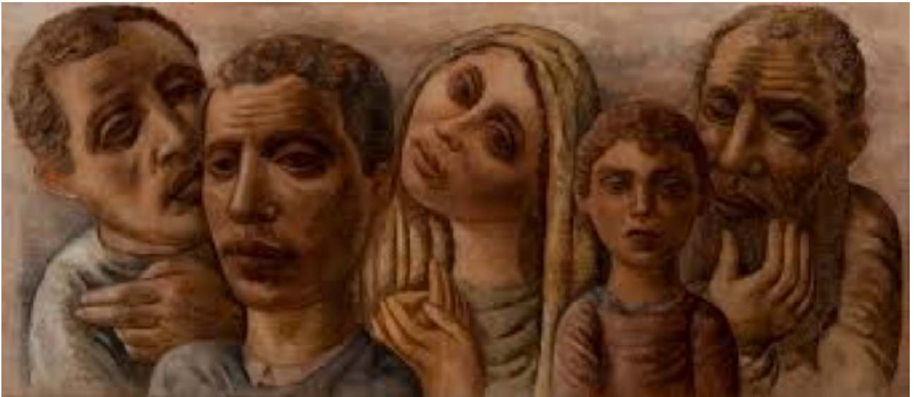
Lasar Segall *21.7.1891 in Wilna, †2.8.1957 in Sao Paulo, „Emigrantes“