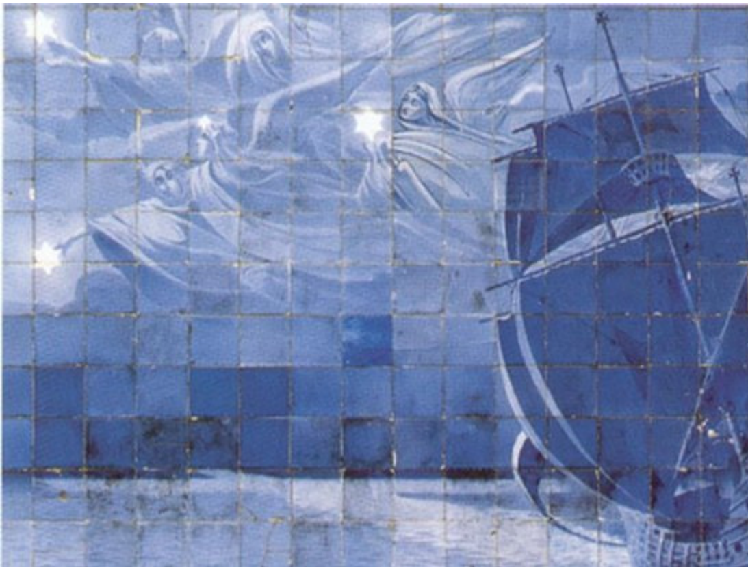
Cruzeiro do Sul , painel de azulejos de Jorge Colaço, 1922. (Pavilhão Carlos Lopes, Lisboa).

Abaixo a imagem do Cruzeiro do Sul, ilustrada com o Canto V, 14 de Camões, onde também o famoso poeta aponta o esquecimento que dela tinha-se até o início da expansão ultramarina.